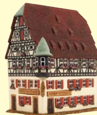
マリエン薬局 (ドイツローテンブルグ) 高さ約23cm ¥11,800+税