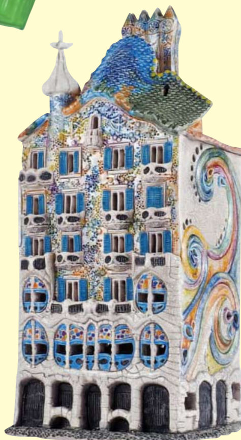
カサ・パトリヨ (スペインバルセロナ) 高さ約28cm ¥24,800+税