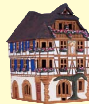
住宅 (フランスケゼルスベール) 高さ約18cm ¥9,300+税